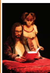
Vampire de la rue morgue