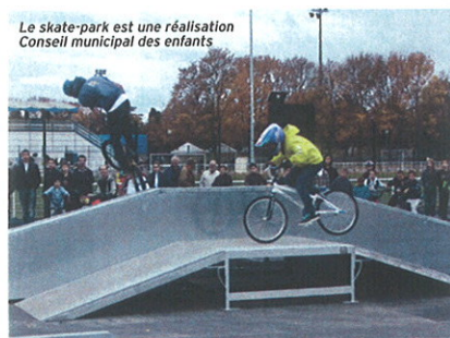
Le skate-park est une réalisation Conseil municipal des enfants