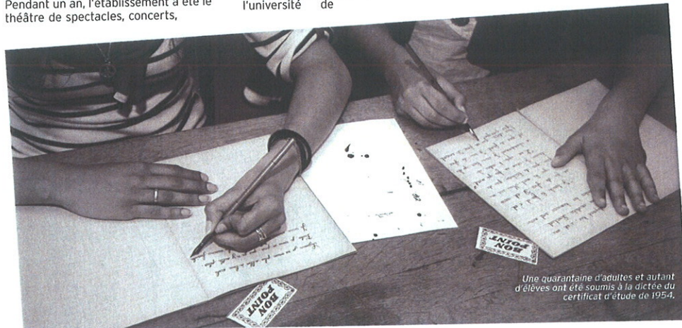
Une quarantaine d'adultes et autant d'élèves ont été soumis à la dictée du certificat d'étude de 1954.

Poitiers a rempli la Collégiale Sainte-Croix. L'exposition intitulée "Les Images de l'histoire" a réuni plus de mille visiteurs en quinze jours. De la même façon, l'observation du ciel à l'Aéro-club, en l'honneur des 400 ans de la découverte de Galilée, a rencontré un beau succès. "Notre principal motif de satisfaction reste d'avoir ouvert le lycée aux habitants", conclut le proviseur.