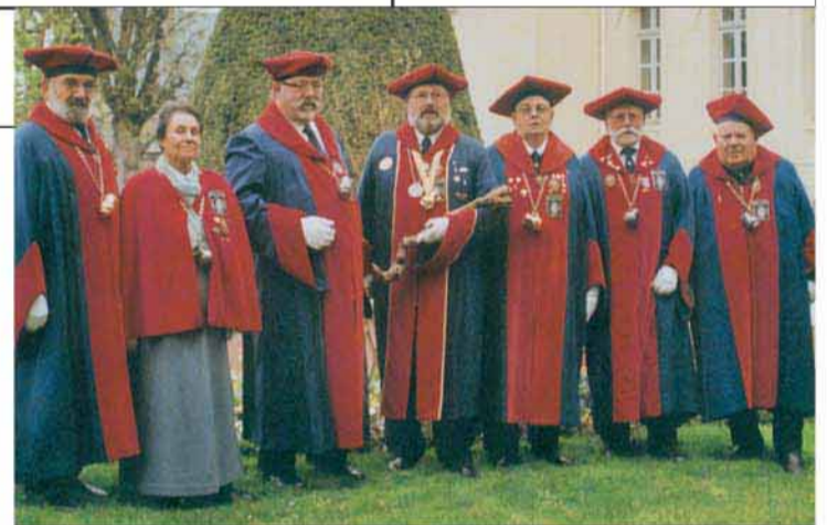
Le grand conseil de l'ordre réuni autour du grand Prieur

Je suis grand prieur depuis un an. Auparavant j'étais maître de cérémonie,