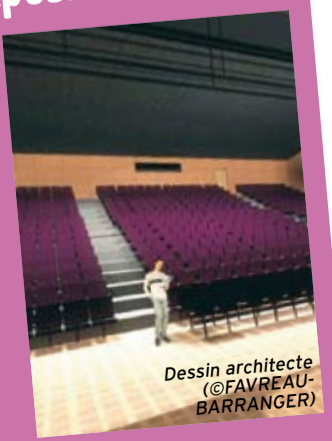
Dessin architecte (©FAVREAU-BARRANGER)

Le service culturel donne également rendez-vous les 15,16 et 17 octobre pour un week-end spécial réouverture.