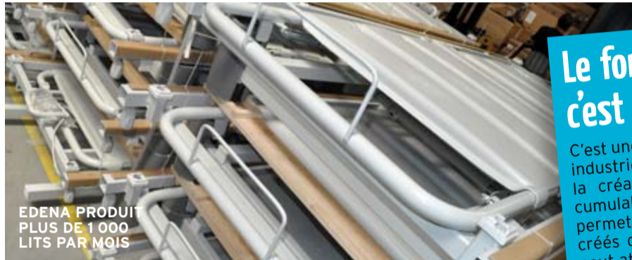
EDENA PRODUIT PLUS DE 1 000 LITS PAR MOIS

Aujourd'hui, à la faveur d'un personnel expérimenté, la capacité de production de la PME loudunaise dépasse les 1 000 lits par mois. Edena devient un acteur de référence. Depuis 2008, la production a été multipliée par deux.