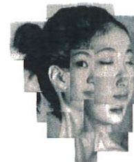
Photo-sculpture et anamorphose